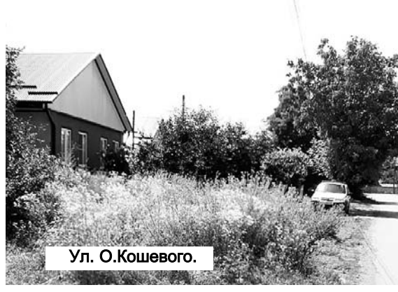
Ул. О. Кошешово.

бросается в глаза, памятник Джикаеву, вернее, то, что от него осталось. Но речь уже не идет о памятнике, а о пустыре, где он стоял. Он зарос амброзией и сорняком, особенно много их на устроенной рядом стоянке большегрузных автомашин.