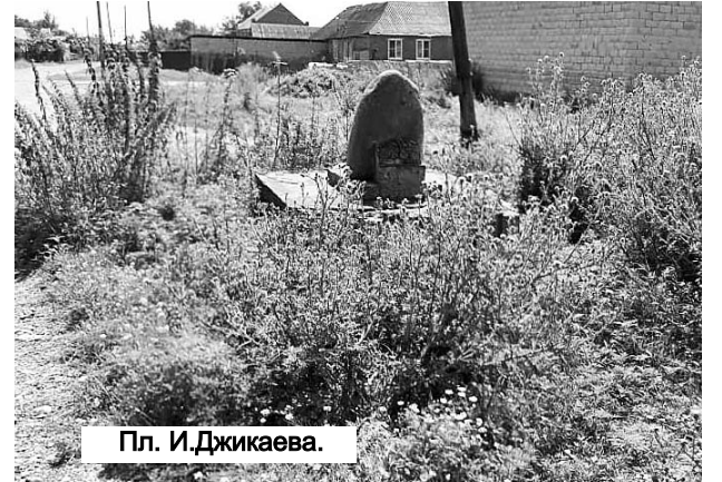
Пл. И. Джикаева.

расстояния. Амброзия вызывает различные аллергические заболевания — бронхиальную астму, сенную лихорадку, крапивницу и др. Поэтому нельзя мириться с такой миной замедленного действия, которая может "взорвать" здоровье любого, живущего рядом с зарослями амброзии. Не будьте равнодушными, уничтожайте каждый куст этого карантинного сорняка!